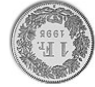
Der Franken ist die Grundeinheit von Geld.