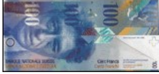
10 Zehnernoten ergeben eine Hunderternote.