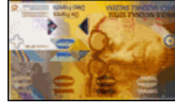
10 Franken ergeben eine Zehnernote.