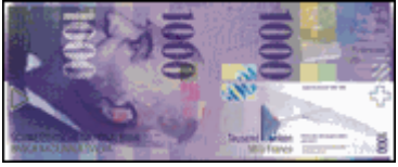
10 Hunderternoten ergeben eine Tausendernote.